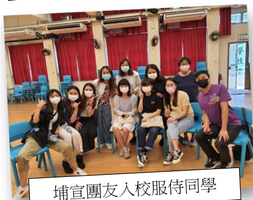
埔宣團友入校服侍同學