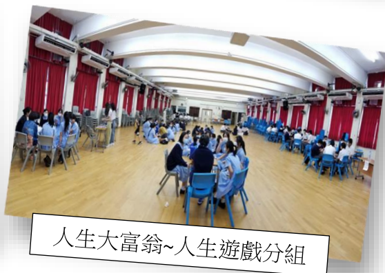
人生大富翁~人生遊戲分組