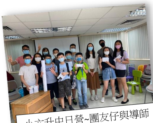
小六升中日營~團友仔與導師

另外，亦感恩將會有數位小六升中的兒童部小弟兄小姊妹，在9月加入少青部。在7月11日下午少青部與兒童部在教會合辦--小六升中日營亦順利舉行。